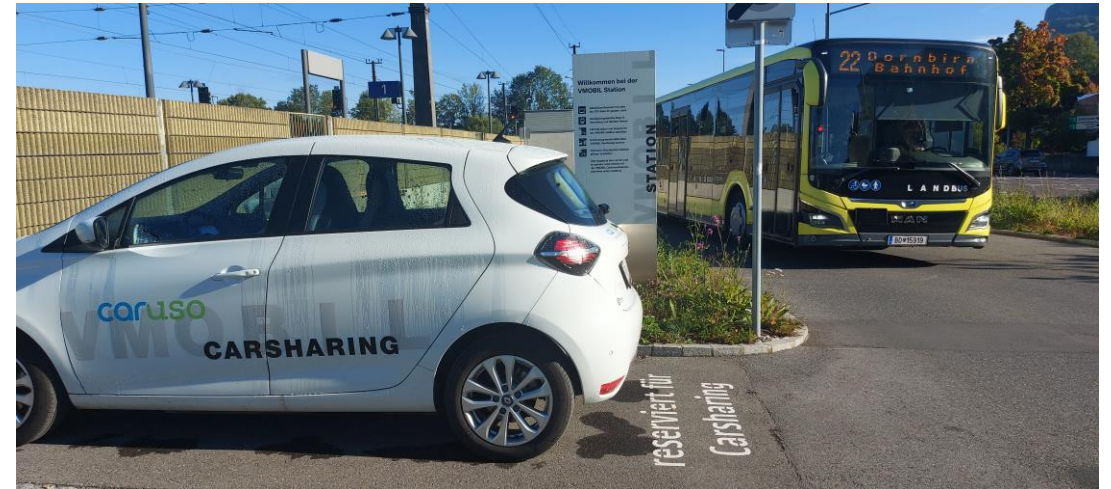
VMOBIL Station Hohenems