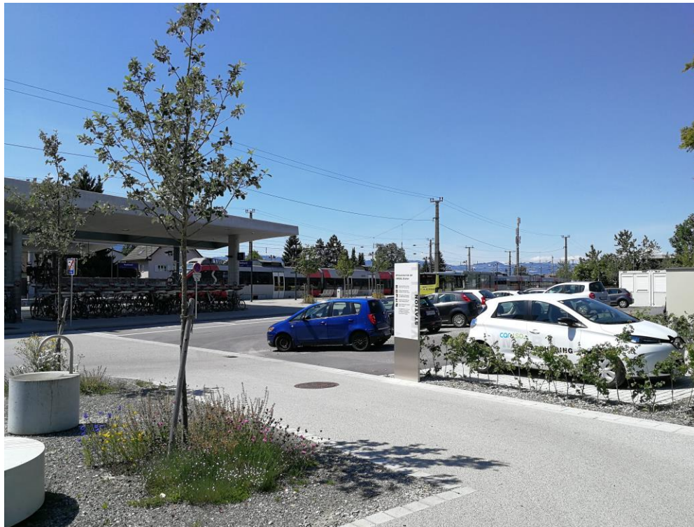
VMOBIL Station Rankweil